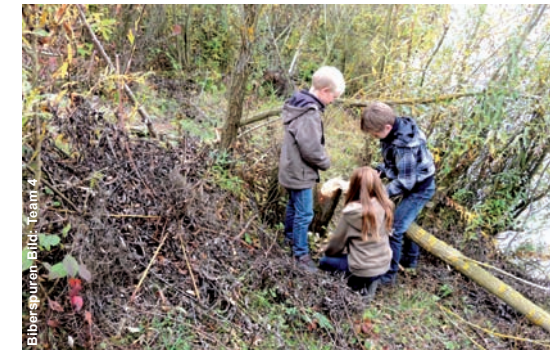
Biber Spuren